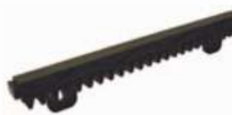
CRIS 100 Nylonový hřeben s kovovou výztuží. 28x20x1000