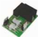
BAT K2 Nabíječka pro Bat M016