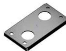
PDY 100 Základová deska pro montáž na zem