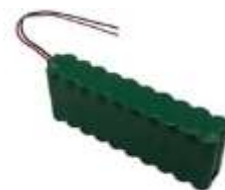
BAT M 016 Baterie 24V 1,6 Ah pro Star D 124