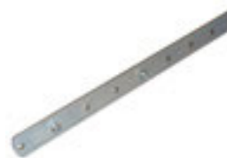
SRO 02 přídavné táhlo k oblouku