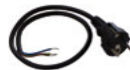
SPI 01 síťový kabel 70 cm