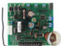
STAR GD Náhradní řídicí jednotka Book 600 / Book 1000