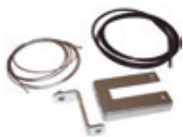
SBLO 01 odblokovací sada s ocelovým lankem na kliku