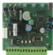
STAR GD 20 LED Náhradní řídicí jednotka Book 600 LED / Book 1000 LED